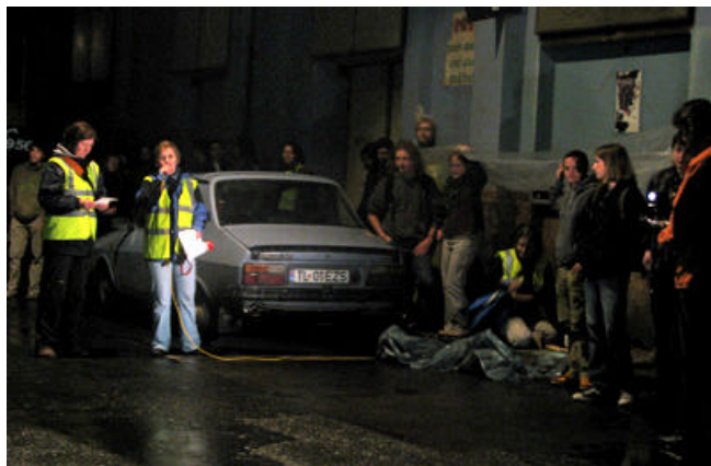
A fluoreszkáló mellényes alakok nem rendőrök, hanem a szervezők

Egyre többen követik őket a Deák Ferenc utcába, kitekert nyakkal bámul a tömeg a magasba. A helyi étterem alkalmazottai is kijönnek az ajtó elé, ahol egy szervező magasra tartja a hangszórót. Innen a Bolyai utcába, majd a fotér felé vesszük az irányt. Közben azon vitatkozunk: ha befalunk egy villanykörtét, tényleg nem tudjuk kivenni a szánkából? A szervezők mindenesetre azt tanácsolják: ne próbáljuk ki a filmben látott fogadást.