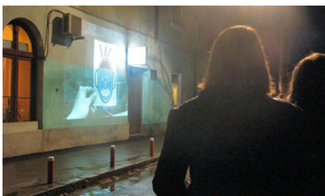
A Wall Is A Screen-vetítéseknek csak olyan épület szolgálhat felületül, amelynek lakói vagy tulajdonosai beleegyeznek. Jó előre le kellett tehát egyeztetni a hét kolozsvári helyszínt

„A Wall Is a Screen” (A fal egy képernyő) projekt hamburgi kezdeményezői a mozi melletti kis utca egyik házának falára vetítettek, röviden felkonferálják a filmet németül és románul, majd vetítés után szedik is a cuccot: a minilaptopot, az erősítőt, a hangszórókat és néhány állványként szolgáló dobozt, és szaladnak a következő helyszínre, hogy mire a tömeg odaér, folytatódhasson a mozizás.